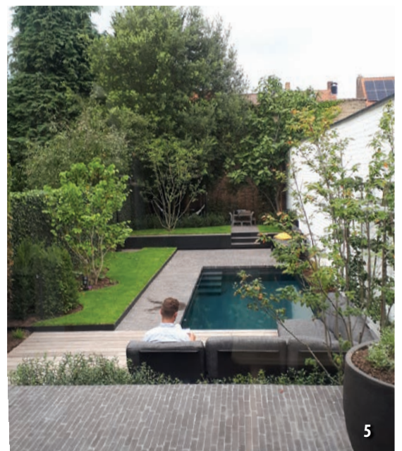
1, 2, 3, 4, 5: Tuinonderneming Monbaliu