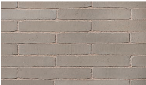
Salvia • Sauge Salbei