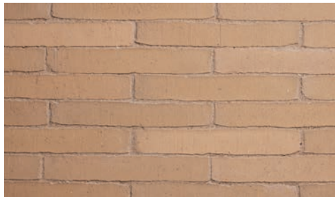
Vanille Vanilla • Vanille