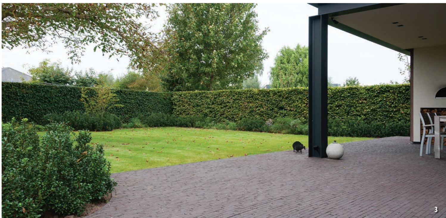
1, 2, 3: Tuinonderneming Monbaliu