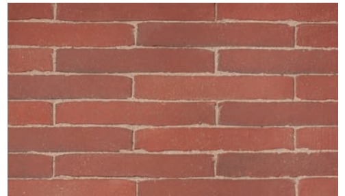
Karmijn • Carmin Karmin