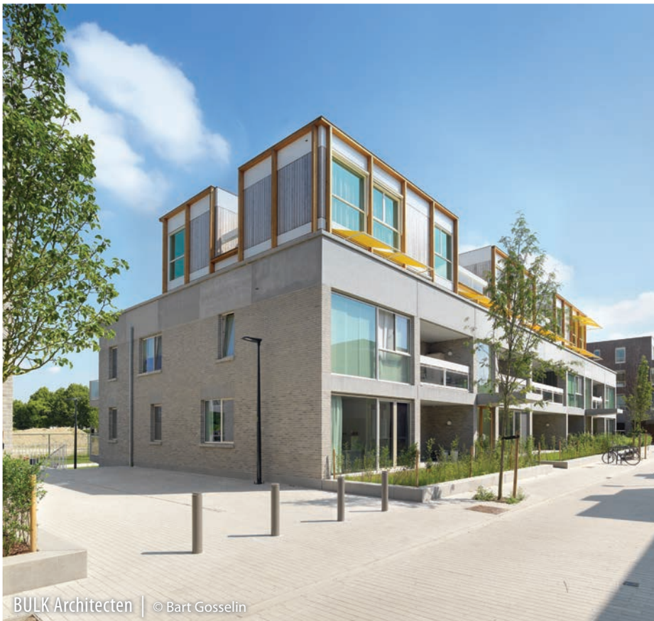
BULK Architecten