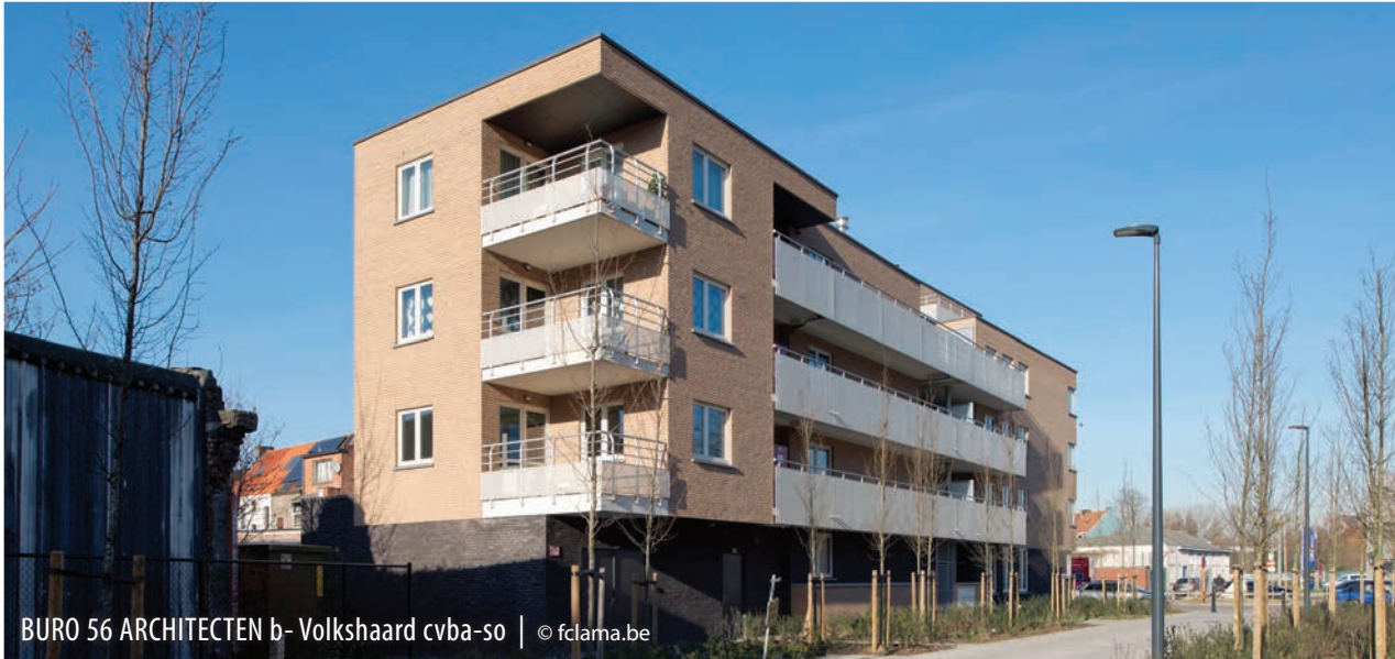
BURO 56 ARCHITECTEN b- Volkshaard cvba-so