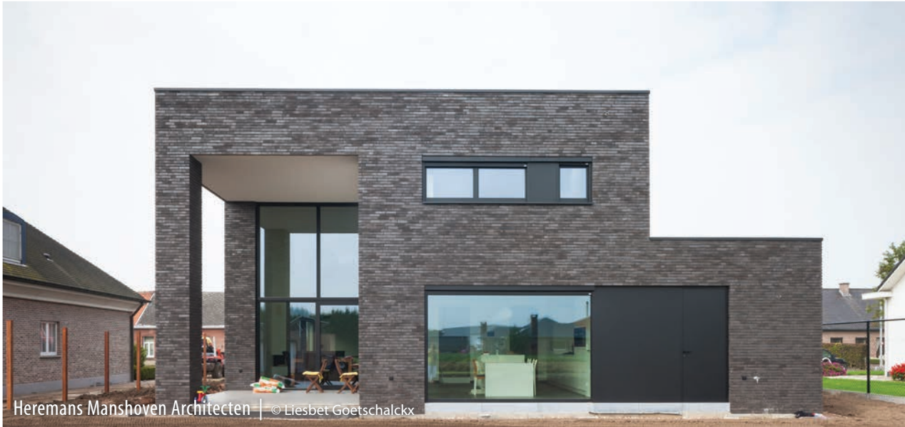
Heremans Manshoven Architecten