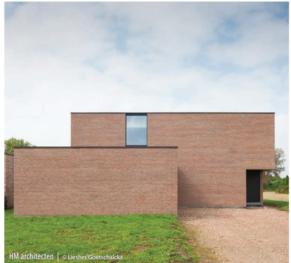
HM architecten | © Liesbet Goetschalckx