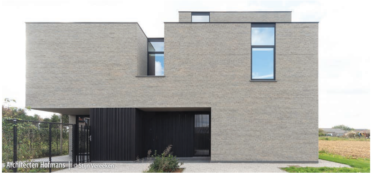
Architecten Hofmans | © Stijn Vereeken