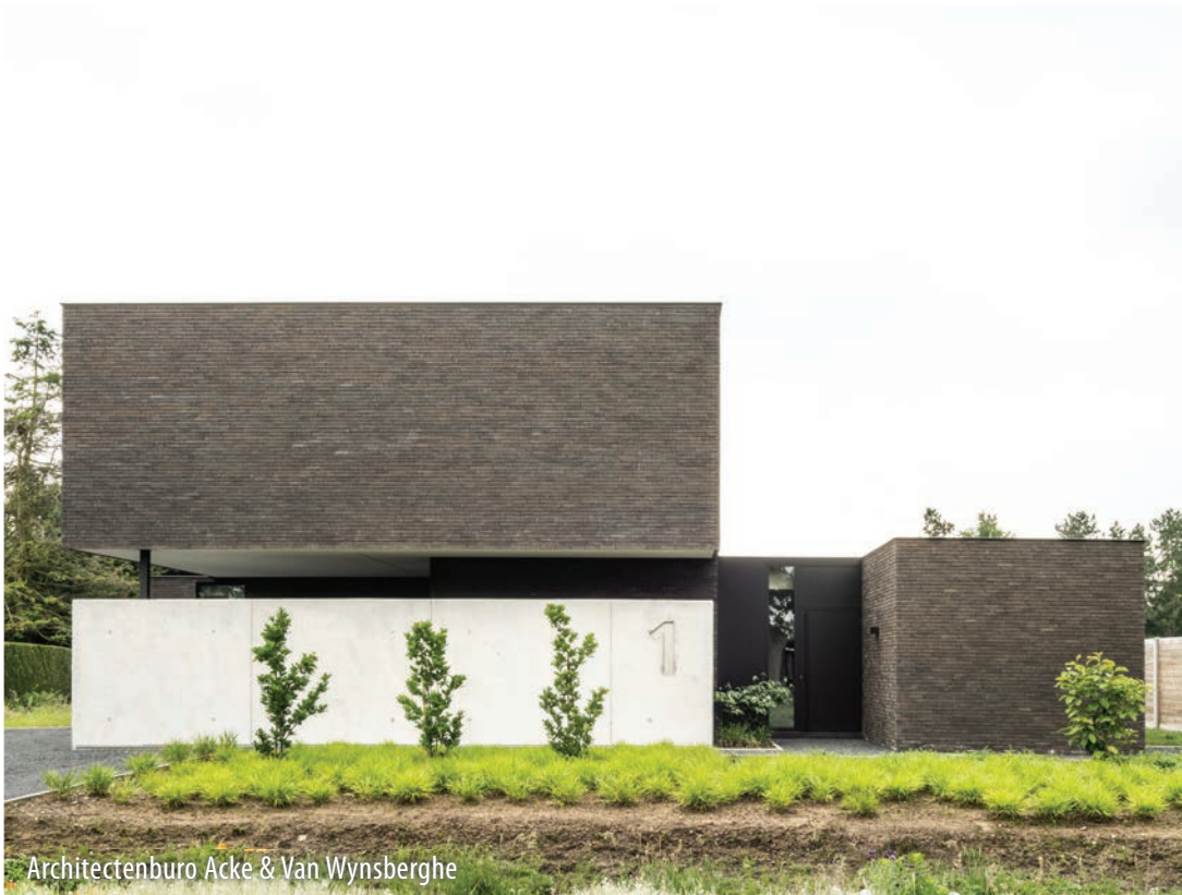
Architectenburo Acke & Van Wynsberghe