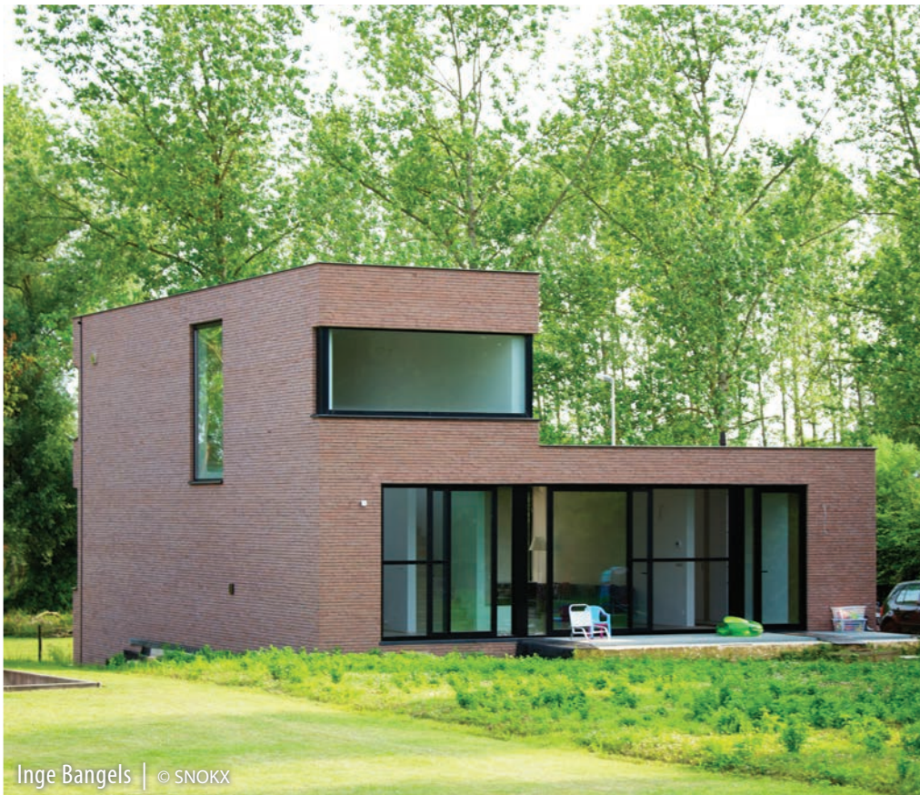
Inge Bangels | © SNOOKX