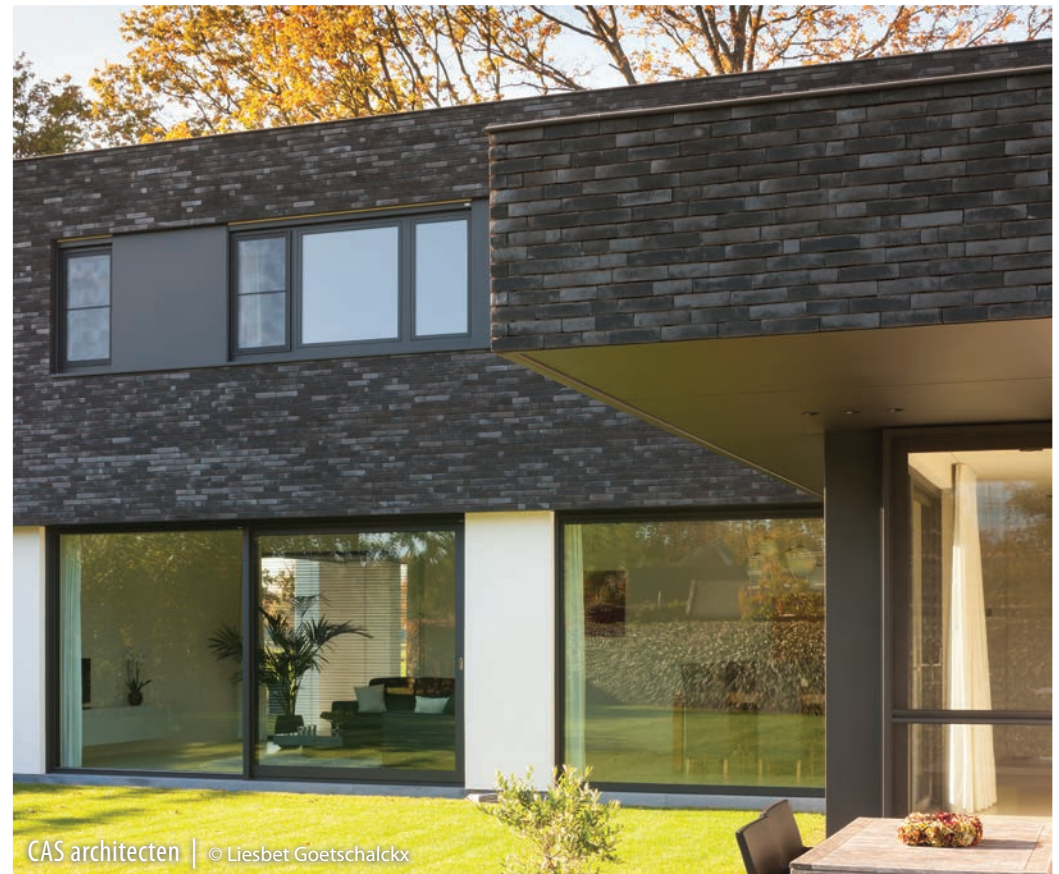
CAS architecten