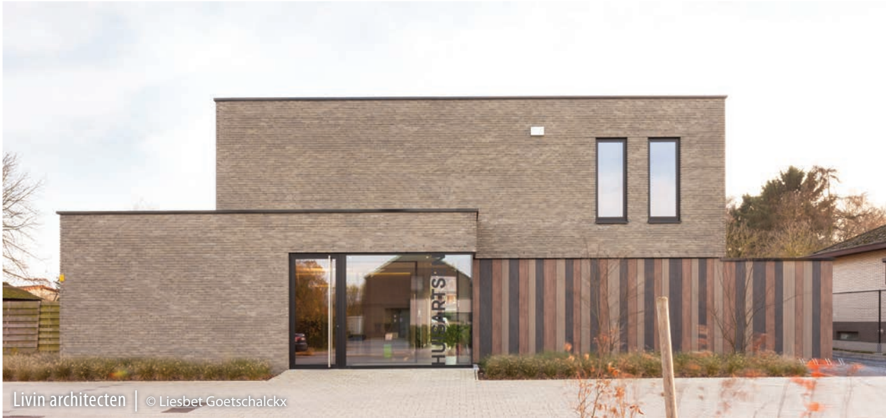
Livin architecten