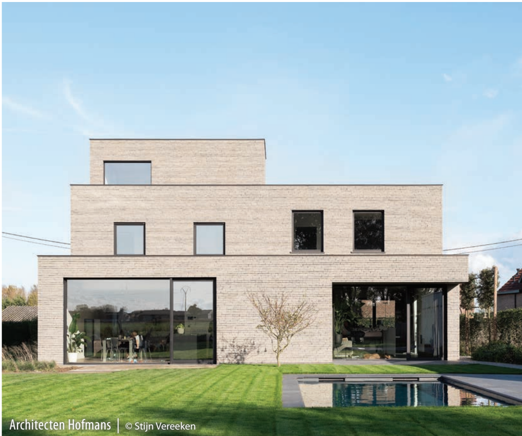
Architecten Hofmans | © Stijn Vereeken