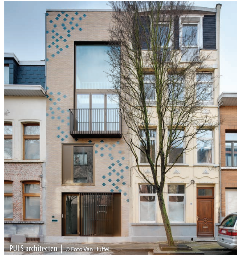
PULS architecten