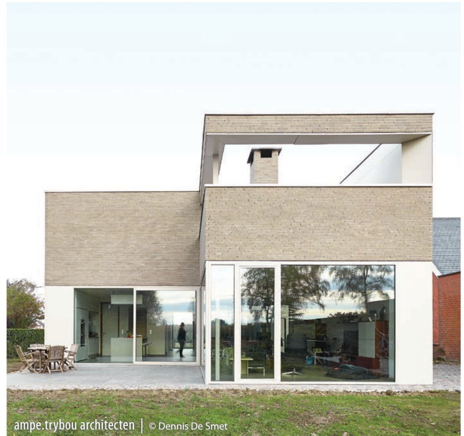
ampe.trybou architecten | © Dennis De Smet