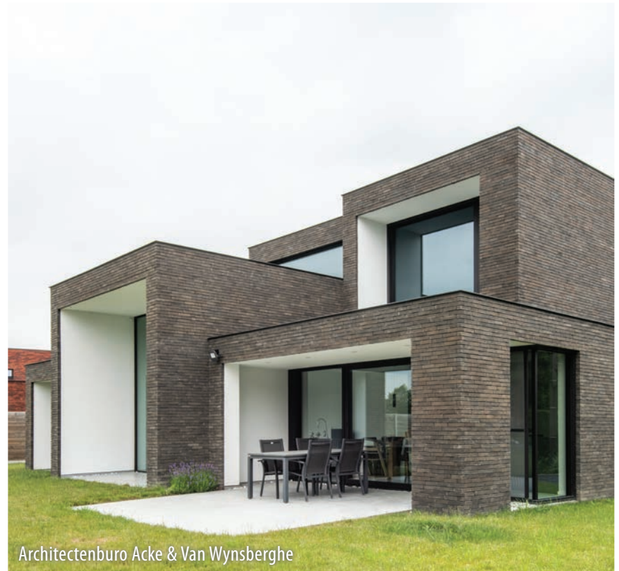
Architectenburo Acke & Van Wynsberghe