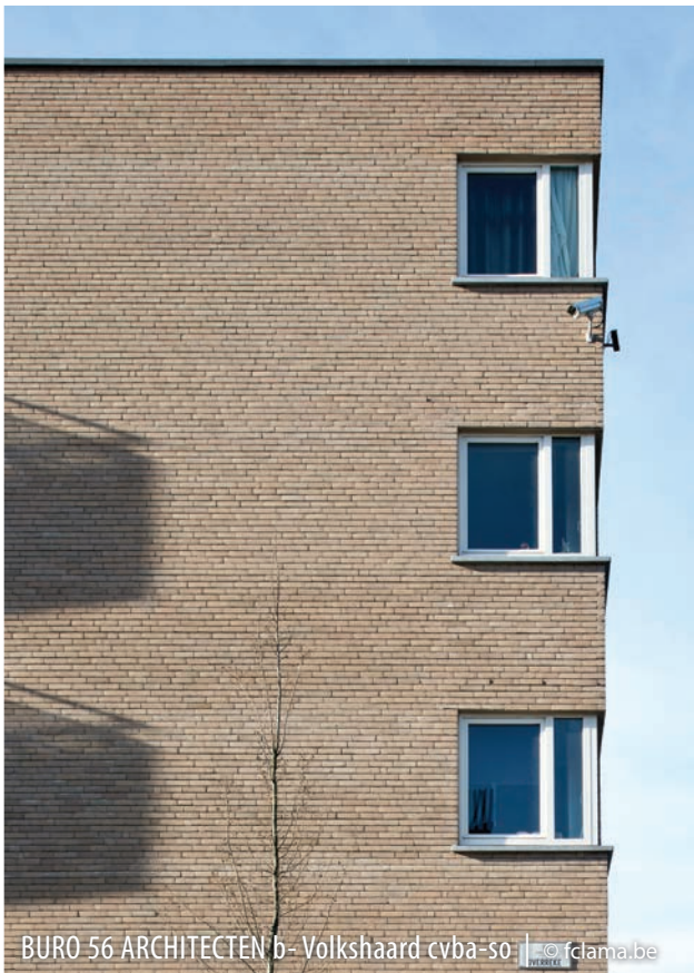
BURO 56 ARCHITECTEN b- Volkshaard cvba-so