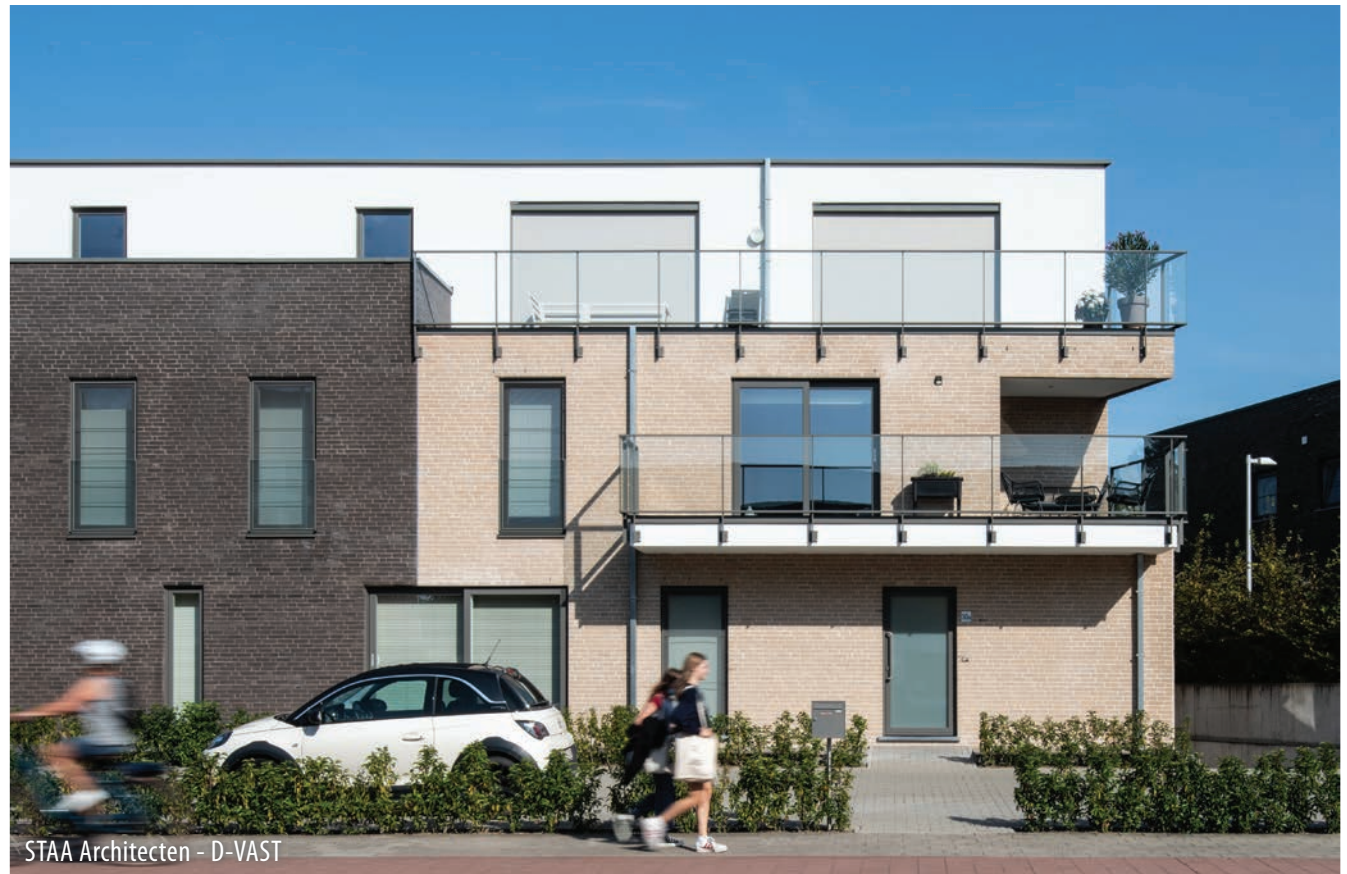
STAA Architecten - D-VAST