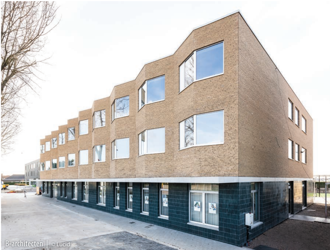
B-architecten | © Lucid