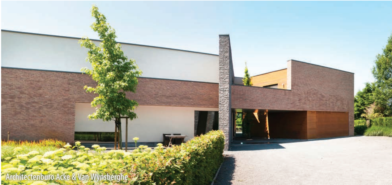
Architectenburo Acke & Van Wynsberghe