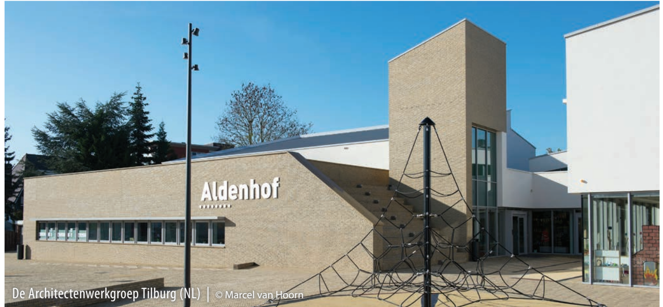
De Architectenwerkgroep Tilburg (NL)