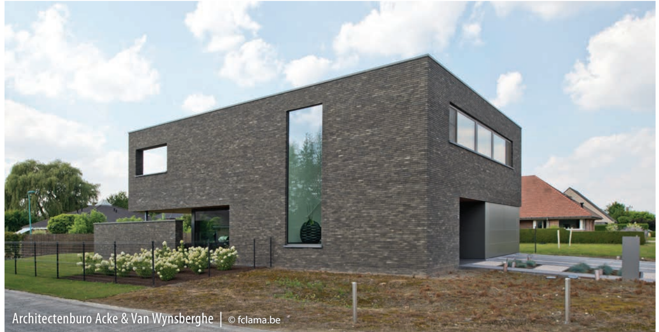
Architectenburo Acke & Van Wynsberghe